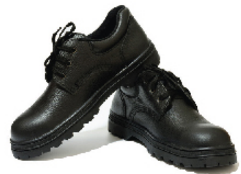
Sapatos de Segurança