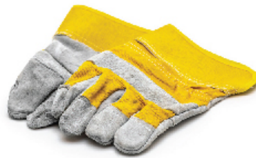
Luvas de Proteção Térmica