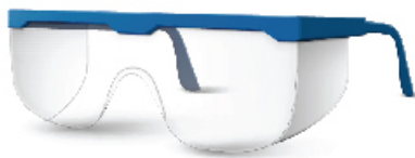
Óculos de Proteção

É recomendado que operadores e técnicos de manutenção utilizem EPI's (Equipamentos de Proteção Individual) adequados ao trabalho e com CA (Certificado de Aprovação).